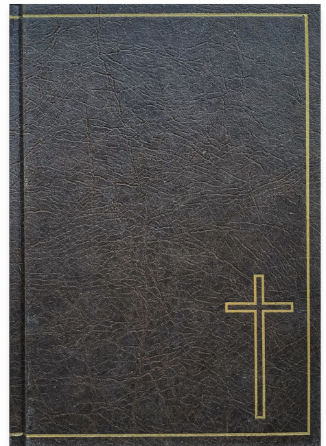
Ausgabe der wendischen Bibel 2021

Ein großer Traum der wendischen Christen erfüllte sich am 4. Februar 2021: Nach 153 Jahren haben wir wieder eine gedruckte Bibel in unserer Sprache. Das Layout des Neudrucks orientiert sich an der Ausgabe von 1868, ist aber im lateinischen Schriftsatz. Dem Inhalt nach ist er identisch mit dem lektoriertem Text der Digitalfassung aus dem Jahr 2017 auf CD oder im Internet. Das Interesse an der niedersorbischen Bibel ist groß: Ca. 150 Exemplare des Neudrucks, der vom Land Brandenburg gefördert wurde, sind bereits kostenlos (oder gegen eine freiwillige Spende) verteilt worden. Aus aus dem Ausland gab es Anfragen, selbst aus Israel oder Brasilien.