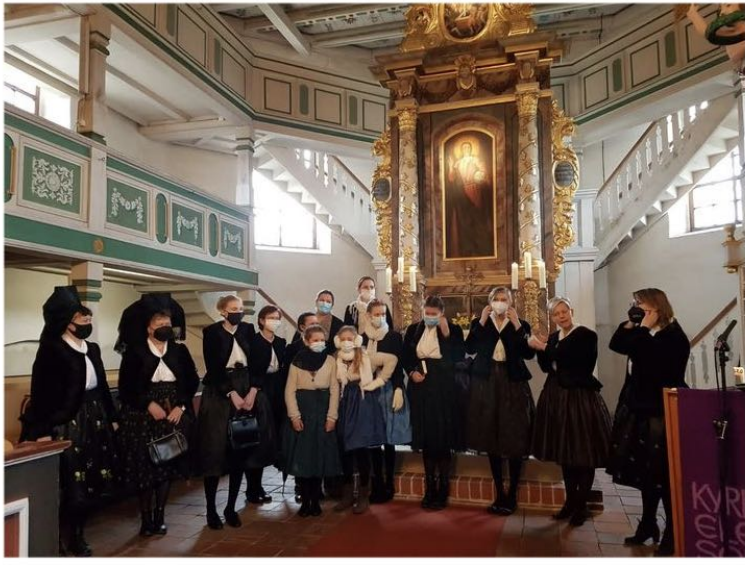
Trachtenträgerinnen zum wendisch-deutschen Gottesdienst in Werben/Wjerbno am 21.3.2021