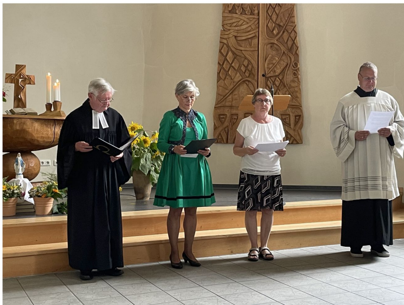
Ökumenischer mehrsprachiger Gottesdienst in Senftenberg/Zły Komerow am 15.8.2021

Worüber wir besonders erfreut sind, das sind die Aktivitäten von neuen Mitstreitern in der Serbska Wósada . Zum zweiten Mal konnten wir in diesem Jahr einen schönen mehrsprachigen