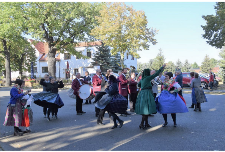
Erntedankfest in Tätzschwitz/Ptačecy am 10.10.2021

Traditionell wurde der wendische Pfingstgottesdienst am Pfingstmontag in Tauer/Turjej unter